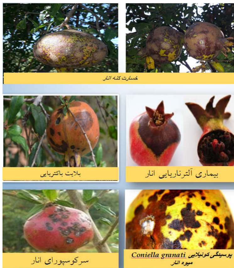
شکل ۳- علائم سایر عوامل خسارتزا ی میوه انار که در مراحل از بیولوژی خود علایم مشابه اسکب انار ایجاد می کنند.